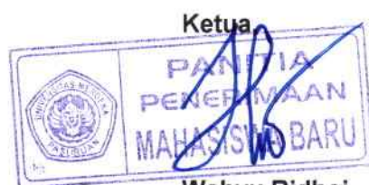
Wahyu Ridhoi NIS. 0118 YPTM